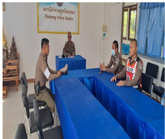
ประชุมผู้รับผิดชอบ OIT งานจราจร