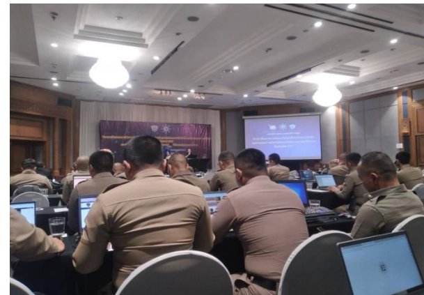
สภ.โพนทอง ได้ส่งตัวเจ้าหน้าที่เทคโนโลยีเข้าอบรมการปรับปรุงเว็บไซต์ ที่ทาง ปปช.ออกให้ความรู้ที่จังหวัดนครราชสีมา