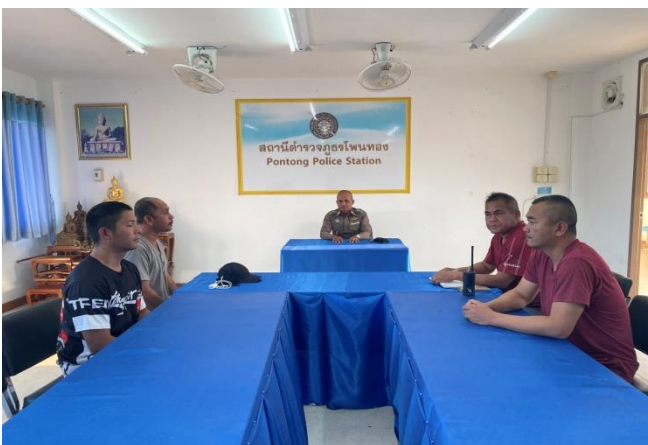
ประชุมผู้รับผิดชอบ OIT งานสืบสวน