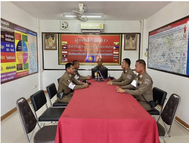
ประชุมผู้รับผิดชอบ OIT งานป้องกันปราบปราม