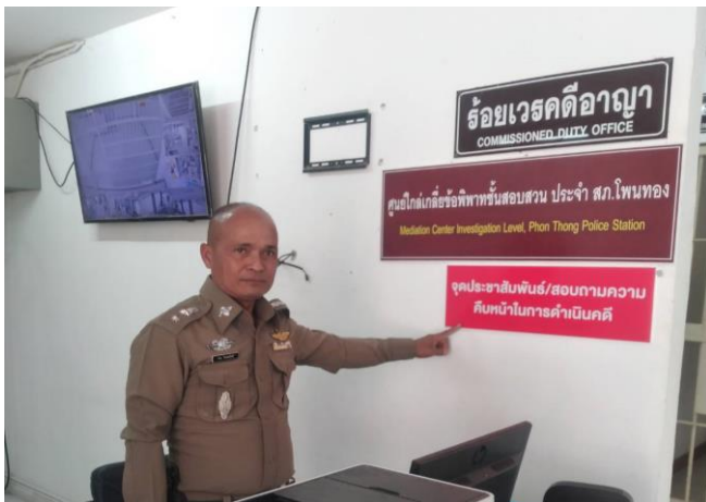
ภาพป้ายประชาสัมพันธ์จุดบริการ