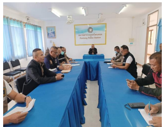
ประชุมผู้รับผิดชอบ OITงาน ออก.และสอบสวน